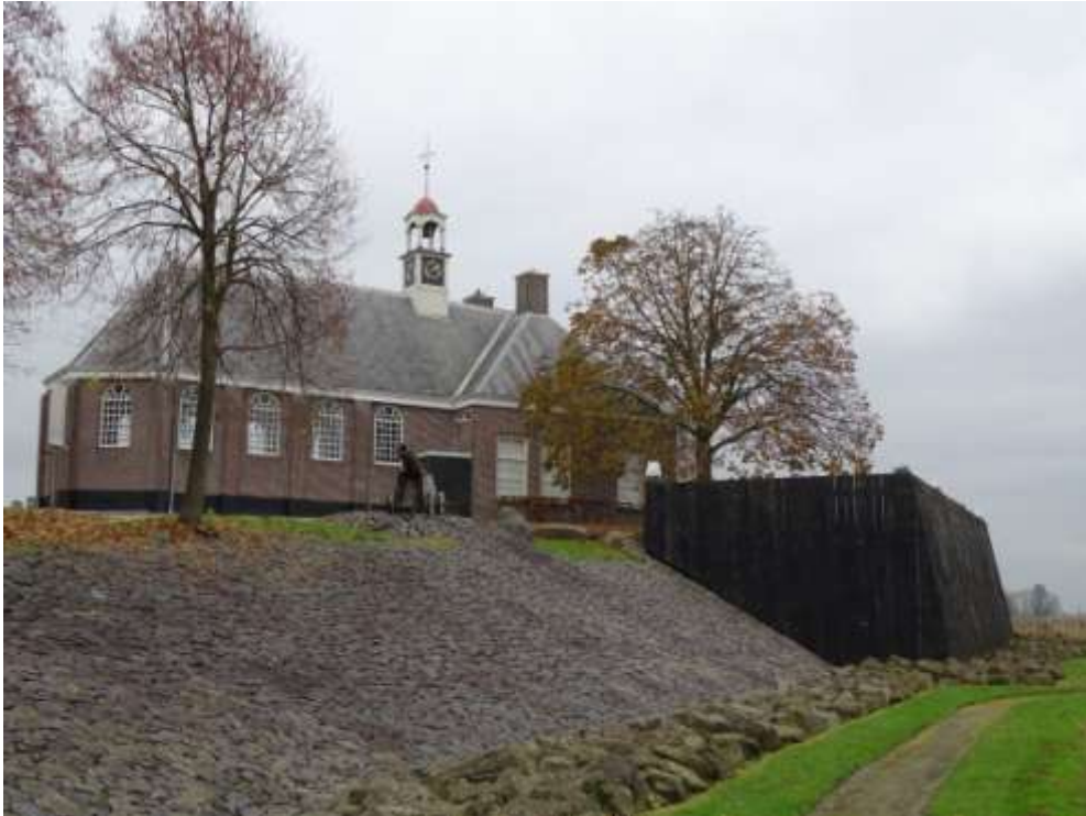
De Nederduits-Gereformeerde kerk van Ens op de terp Middelbuurt, gebouwd in 1834.