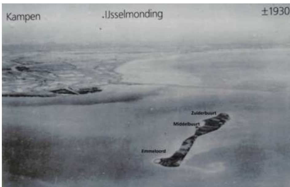
Schokland in 1930

Op de terugreis bedacht ik mij dat er ook een familielid op Schokland heeft gewoond. Thuisgekomen heb ik snel de Nieuwe Kroniek er op na geslagen en jawel ik vond een Hazelhoff-dochter die in de negentiende eeuw met een Schokker visser trouwde en naar het eiland verhuisde. Opnieuw een stukje verwevenheid tussen vaderlandse- en familiegeschiedenis. Voor mij maakt dat het familieonderzoek zo boeiend.