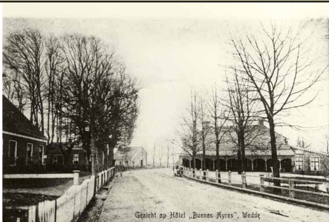
Ansichtkaart met rechts van de weg hotel Buenos Ayres, het vroegere borggraafhuis.