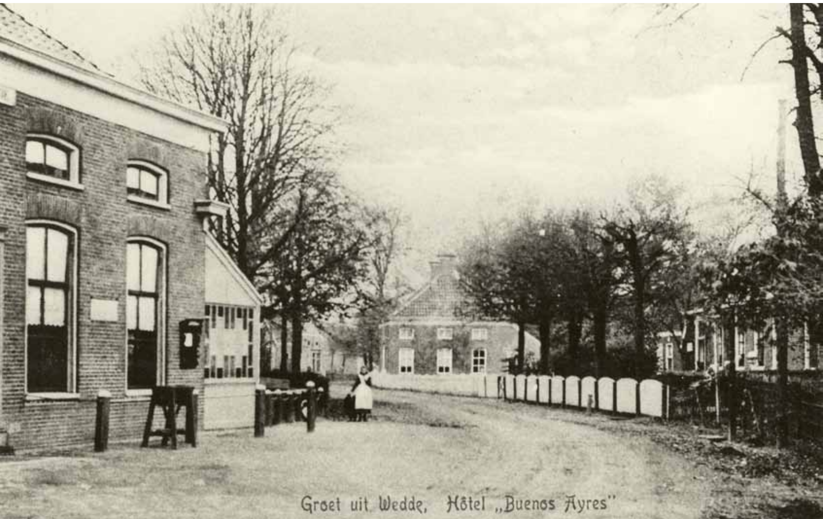
Ansichtkaart met links hotel Buenos Ayres, het vroegere borggraafhuis.